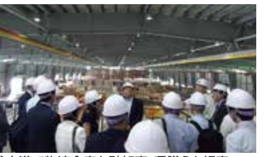
釜山港で物流倉庫を馳知事、県議らと視察