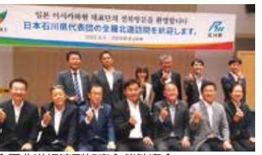
全羅北道経済副知事主催歓迎会

8月に県議会友好促進連会長として馳知事らと韓国を訪問しました。全羅北道では、知事、議会議長と懇談、今後交流を進めることを約束。また、釜山新港を視察、大韓航空では小松・ソウル線の復活要望をしました。