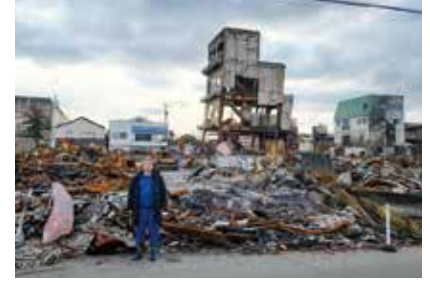
あまりの酷さに、しばし呆然と立ち尽くしました(輪島市内中心部)

私もすでに何回か現地を訪れましたが、特に被害の大きかった輪島や珠洲市では、まだまだ多くの方が厳しい状況にあると聞きます。水道も来ていないところもあり、倒壊住宅の公費解体はこれからです。多くの方が早く故郷に戻って、仮設住宅に入れることを望んでいますが、それも足りていない状況です。石川県は復旧、復興に当たり「創造的復興」を掲げ、この際に福祉や過疎対策の課題などを一気に解決、推し進めようとしています。まさに「災い転じて福となす」です。町々や人々に再び元気が戻るよう、石川県に住むものとして支援金やボランティアなど、できることを精いっぱいやっていこうではありませんか。