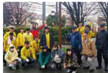
金沢南ライオンズクラブの玉川図書館花植え(会長を務める)