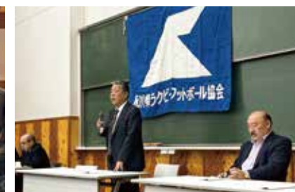
石川県ラグビーフットボール協会総会にて(会長)