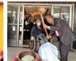
県営大桑団地開町50周年式典において