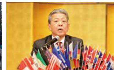
全国LCC大会にて金沢南会長として祝辞