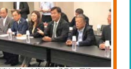
知事を中心に大韓航空の役員らに要望