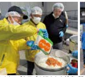
ライオンズクラブの皆さんと輪島・門前で炊き出しを行いました