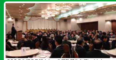
200名を超える皆さんへの県政報告を行いました