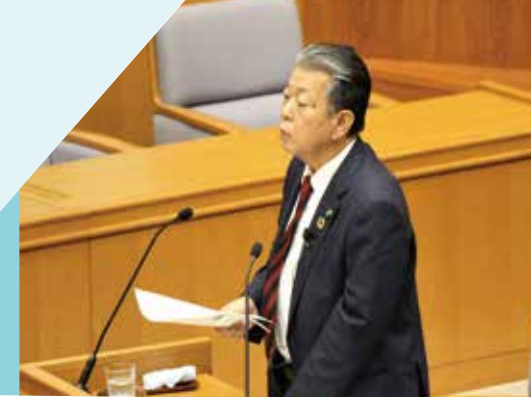
令和6年2月定例会予算委員会質疑

皆様のご意見、ご要望を私にお伝えください。 昨年の県議会議員選挙では、力いっぱい訴えました。