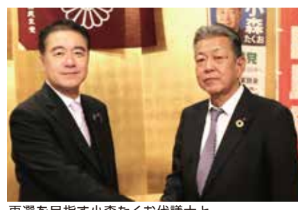
再選を目指す小森たくお代議士と

住んで良かった、これからも住み続けたいと思える街に! 「石川・金沢」の発展に 「経験と刷新力」を活かして、 全力で頑張ります!!