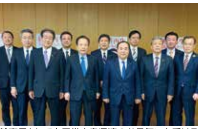
幹事長として自民党広島県連のお見舞いを受ける