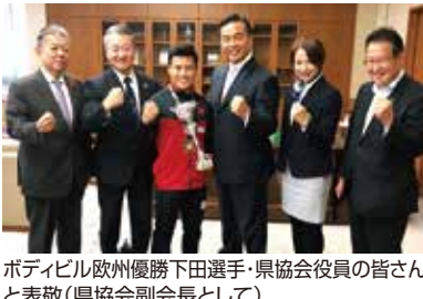
ボテビル欧州優勝下田選手・県協会役員の方々と表敬(県協会副会長として)