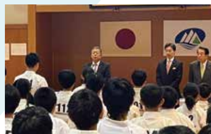
極真会館石川県空手道選手権大会(筆頭顧問)