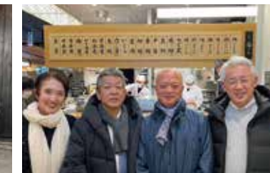
SAKE食堂BY農口のお披露目で友人達と(金沢駅)