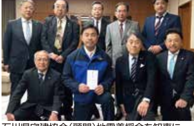
石川県建協(顧問)地震義援金を知事に